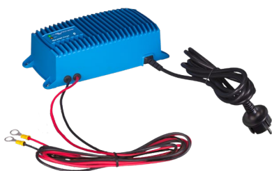
Chargeur Blue Smart IP67 12/25